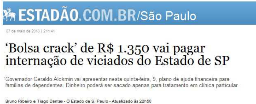
Figura 6– Manchete de matéria sobre a “bolsa crack”

O governador do Estado de São Paulo, Geraldo Alckmin, propôs um programa que pretende pagar R$ 1.350,00 por mês para famílias que tenham parentes usuários de crack . As famílias irão receber essa bolsa do governo do Estado de São Paulo para custear a internação do familiar em clínicas particulares especializadas. O valor não será dado em dinheiro, mas através do chamado “Cartão Recomeço”. As internações terão período de seis meses, totalizando um ganho de R$ 8.100,00 por usuário. Outro detalhe: as clínicas “beneficiadas” pelo programa serão escolhidas pelo Governo Estadual. Programa similar a esse acontece no Estado de Minas Gerais, onde o programa chama-se “Aliança pela Vida” e oferece uma bolsa de R$ 900,00. Ambos foram apelidados de “bolsa crack ”.