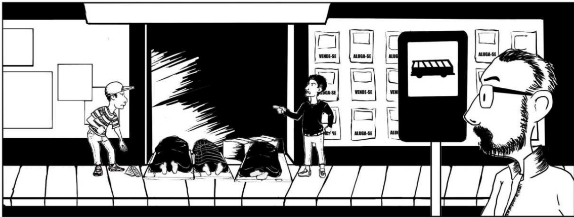
Figura 2– Uma marquise nebulosa

no ônibus, vi que o pessoal da saúde já estava caminhando em outra direção, que os moradores de rua continuaram no mesmo lugar e que o senhor e a mulher não estavam mais embaixo da marquise. Depois de alguns movimentos, a fotografia voltou a ser parecida com a do início, embora as vidas dos atores não sejam mais as mesmas de antes desse inusitado encontro que, de alguma forma, mobilizou, por alguns minutos, aquele retrato de cotidiano urbano.