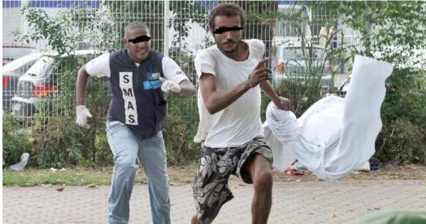
Figura 4– Ação da SMAS/RJ

Para o filósofo francês Gilles Deleuze, o que nos força a pensar são os signos, objetos de um encontro que não é inerente a nós, e sim uma criação verdadeira: “a criação é a gênese do ato de pensar no próprio pensamento” (DELEUZE, 1987, p. 96). Nessa perspectiva, pensar é romper com a imobilidade a partir da força dos signos que movem o próprio pensamento que, por sua vez, explica, traduz e dá sentido aos signos (BILIBIO, 2009). Pensar é romper com a passividade, é deixar-se afetar por forças externas que te mobilizam, que te fazem querer interpretar e decifrar esses signos (VASCONCELOS, 2005).