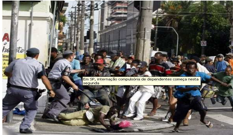
Figura 5– Reportagem sobre as internações compulsórias em São Paulo

Na capital paulista, a estratégia para recolhimento de pessoas em situação de rua e usuárias de drogas foi a internação compulsória. O modus operandi era muito parecido com aquele praticado na capital carioca, contudo, em São Paulo, houve o acréscimo do setor saúde na composição das equipes que intervinham nas cracolândias. Ressurge também a figura das comunidades terapêuticas e das clínicas privadas para desintoxicação como locais indicados pelo governo como destino para moradores de rua e/ou usuários de drogas.