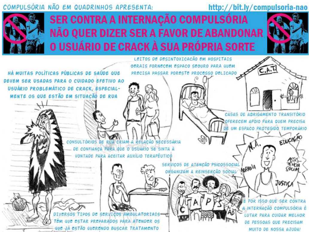
Figura 7 – Material produzido pela Frente Nacional Drogas e Direitos Humanos, mostrando a rede de serviços e equipes que podem ajudar a pessoa usuária de drogas.

questões) pelo uso abusivo de drogas, é preciso investir tanto em serviços públicos de saúde e assistência social novos quanto naqueles que já existem e são preconizados pela Lei da Reforma Psiquiátrica. Tal defesa pauta-se em dispositivos para que as pessoas possam buscar tratamento de forma voluntária, consentida e não afastada do convívio social e das ruas. Aqui não se descarta a internação para desintoxicação em um hospital geral; o que se reivindica é que essa internação deve partir do desejada pessoa e que ela tenha acesso a diferentes políticas e serviços quando sair do hospital. Um desses coletivos produziu a seguinte imagem a partir da rede de serviços que já existe para atender pessoas que sofrem pelo uso abusivo de drogas: