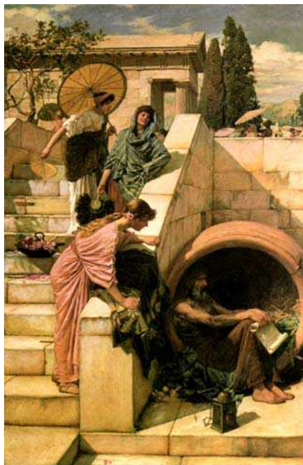
Figura 8 – Diógenes, “o filósofo do barril”

A partir disso, compartilho da ideia de que nem sempre o viver na rua foi um problema para a sociedade e nem sempre as pessoas em situação de rua foram consideradas loucas, drogadas ou vagabundas. Portanto, tomarei a narrativa sobre o filósofo Diógenes na Grécia Antiga como um marco possível para contar a história dos moradores de rua.